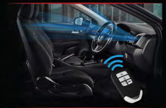
> Remote Engine Start