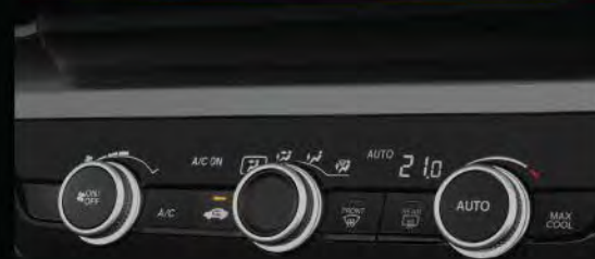
> Auto A/C