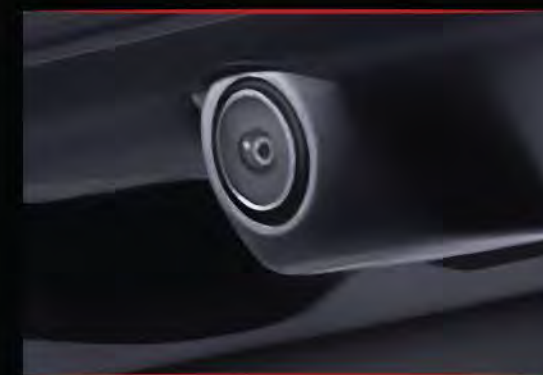
> Multi-Angle Rearview Camera

/ 8-Speakers / Cruise Control / Audio Steering Switch